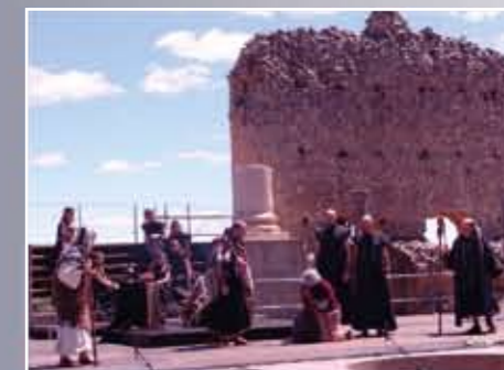
"El grupo Arthistrión representando Edipo Rey en 2018 en Clunia"

Dioniso, hijo de Zeus y Semele, llega a Tebas. Lo hace porque el rey Penteo ha prohibido la difusión de su culto. Enloquece a las mujeres que celebran su culto en el monte Citerón. Terribles desgracias se abaten sobre todos los que se oponen a él. Ágave, madre del rey Penteo, está al frente de uno de los coros de bacantes. Esta, enloquecida, creyendo dar muerte a un cachorro de león, acaba con la vida a su propio hijo.