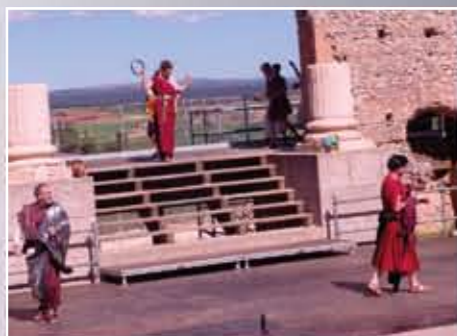
"El grupo Arthistrión representando Cásina en 2018 en Clunia"

La meretriz Filocomasia, en ausencia de su amado Pleusicles, es llevada de Atenas a Éfeso contra su voluntad por el soldado Pirgopolinices. Pleusicles, avisado por su esclavo Palestrión, ahora al servicio de Pirgopolinices, llega a Éfeso y se instala en casa de un amigo de su padre, Periplectómeno, que es vecino del soldado. Surgen entonces un juego de enredos y artimañas del astuto Palestrión para liberar a Filocomasia.